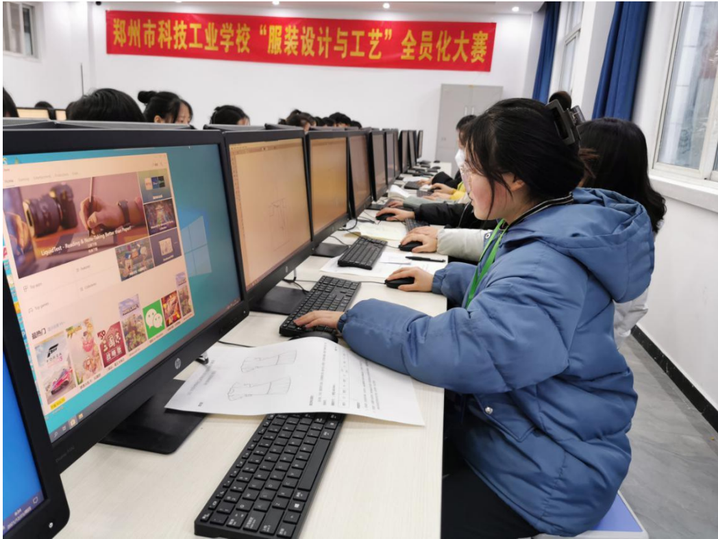
7.2 全员化大赛比赛进行中